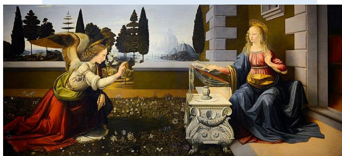
受胎告知/レオナルド・ダ・ヴィンチ (1472年頃)

新約聖書に書かれているエピソードの一つ。処女である聖マリアのもとに大天使ガブリエルが舞い降り、キリストを妊娠した事を伝えそれを受け入れる場面。