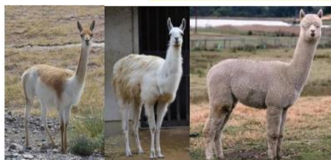
(左から) ビグーニャ、アルパカ、ラマ

豊かさの象徴であるコルヌコピアは古代から人々に愛されてきた。通常果物やブドウ(ワインを飲んでいた為)が描かれるが、100ソル金貨のコルヌコピアからは金貨が見られるユニークなデザインである。