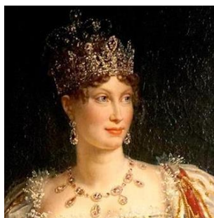
マリア・ルイーザ