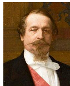
（左）ルイ・ボナパルト （右）妻オルタンス・ド・ボアルネ （下）ナポレオン3世（ルイ・ナポレオン）

兄ナポレオン・ボナパルトの妻ジョゼフィーヌの妹、オルタンスと結婚したルイ。寡黙な性格のルイと陽気なオルタンスは反りが合わず、結婚生活は8年で終了した。