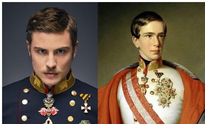
(左) Netflix「皇妃エリザベート」に登場するフランツ (右) 21歳の頃のフランツ