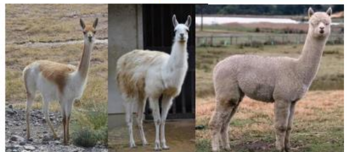
(左から) ビグーニャ、アルパカ、ラマ