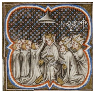
カルロ1世の戴冠式 (1266年)