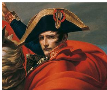
ナポレオン・ボナパルト

コルシカ島の貴族の家系に生まれ、フランス本土で革命政府の軍人となる。 多くの戦争に勝利し、フランス革命を成功させ歴史上最も有名な皇帝の1人となった。 2番目の妻であるマリア・ルイーザと念願の男児であるナポレオン2世を刻印した記念金メダル。 通常サイズよりも一回り大きいレアタイプのご案内。