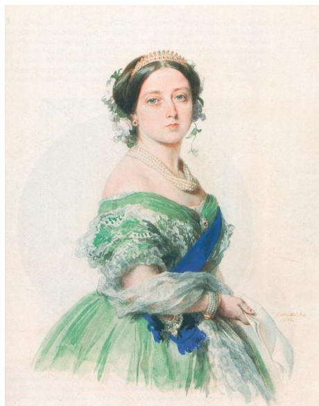
ティアラを被ったヴィクトリア女王の肖像画 (1855年)