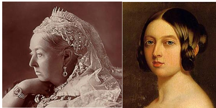
1897年の写真と1841年の写真

ヴィクトリア女王の貨幣は数多く発行されている。その中でもヤング・ヴィクトリアと呼ばれる即位当時(18歳)の肖像画は人気が高く、発行枚数が少ない当該金メダルも人気の1枚である。