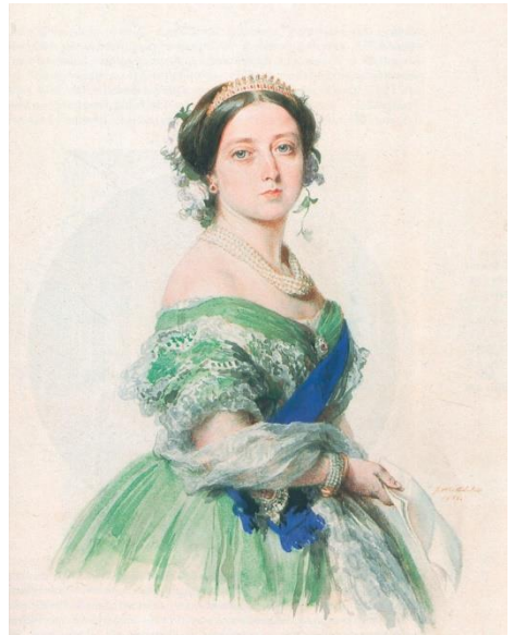
ティアラを被ったヴィクトリア女王の肖像画 (1855年)