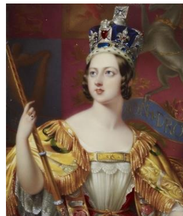
即位当時 (18歳) の肖像画